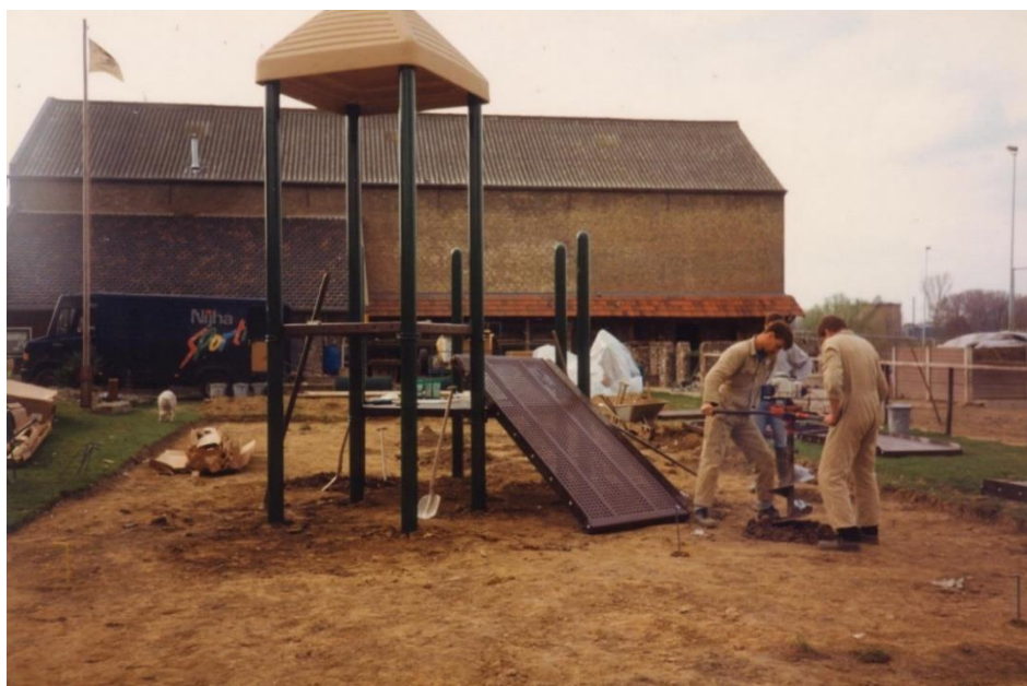
Plaatsen speeltoestel KID BUILDERS april 1992

In april 1992 werd het speeltoestel 'KID BUILDERS' geleverd en geplaatst door de firma Nijha BV uit Lochem. Daarna moest er nog ca. 20 m 3 zand op het speelgedeelte aangebracht worden, en dat kon alleen maar door lichamelijke inspanning van de vrijwilligers met behulp van scheppen en kruiwagens.