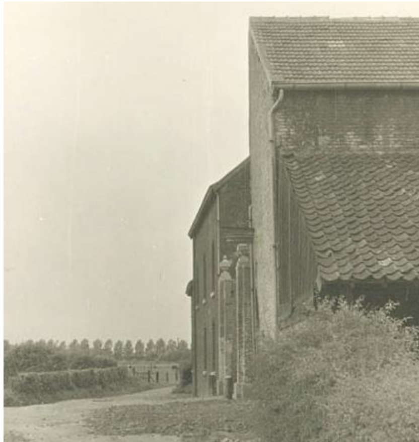
Hoeve Rome ca. 1950, op het dak van de schuur dakpannen

De schuur werd nadien opgeknapt, het dak werd niet meer voorzien van pannen maar van asbest golfplaten.