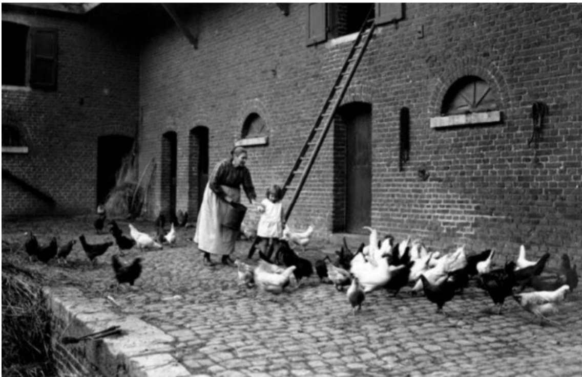
Binnenplaats Hoeve Rome 1938, de stallen waarin RKVCL kantine en kleedlokalen realiseerde

De stallen en de erboven gelegen ruimten werden ter beschikking gesteld aan voetbalclub RKVCL. In zelfwerkzaamheid werden de daken vernieuwd en in de ruimten werden een kantine, diverse kleedlokalen, opslagruimten en een vergaderruimte gerealiseerd. Aan de noordzijde van het complex werden twee voetbalvelden, een oefenveld en parkeerruimten aangelegd. De officiële opening van de nieuwe accommodatie van voetbalclub RKVCL vond plaats op 22 augustus 1986. Om de renovatie van de bovenverdieping en de laatste afwerkingen te kunnen financieren, organiseerde de evenementencommissie van RKVCL een termijnloterij en op zondag 14 juni 1987 het eerste 'Hoeve Rome Feest'. Dit Hoevefeest viel zo goed in de smaak dat er nadien jaarlijks nog vele Hoevefeesten volgden. Jammer genoeg kwam ook hier een eind aan. De voetbalclub werd in 1946 opgericht en de allerlaatste competitiewedstrijd van R.K.V.C.L. was op 14 mei 2017 tegen SV Geuldal. Na deze wedstrijd sloot RKVCL, na 71 jaar, definitief de poort.