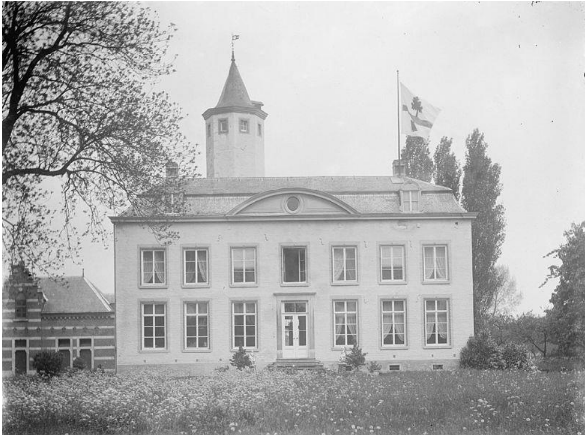
Kasteel Jeruzalem achterkant ca. 1930, links het koetshuis, rechts op het dak de vlag met het familiewapen De Crassier