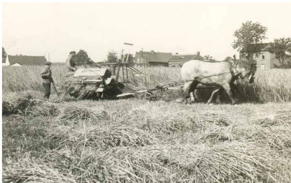
Oogsttijd nabij Hoeve Rome ca. 1926 met zicht op de Emmausstraat

De aanbouw en alles wat hierbij kwam kijken is in zelfwerkzaamheid gerealiseerd door vrijwilligers, t.w. door leden van Buurtraad Limmel en door Limmelse buurtbewoners.