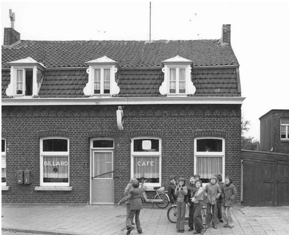
Café van Gerwen, tussen de dakkapellen de speciale kruispannen 15-10-1976