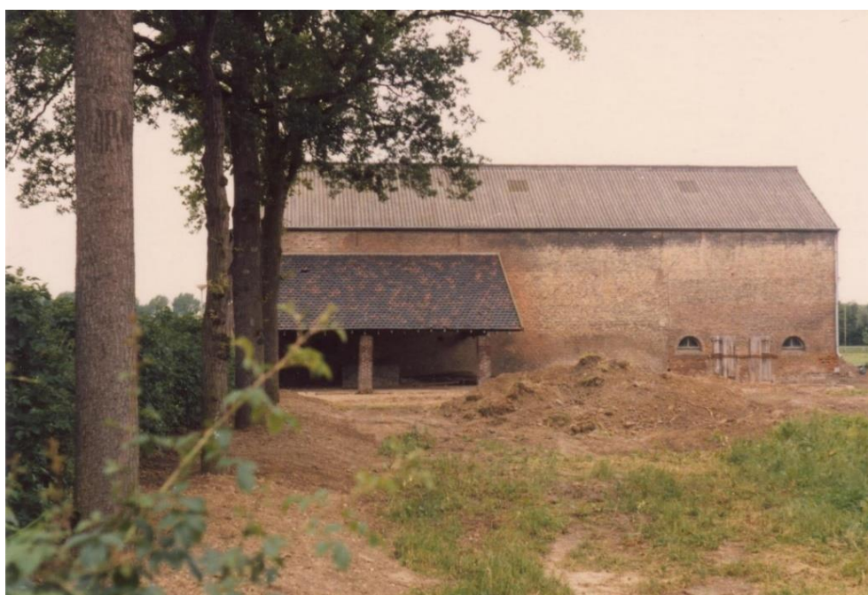
De grote schuur april 1986, links de open aanbouw en rechts de twee boogramen en de deuren van de inpandige varkensstallen

De twee inpandige varkensstallen in de grote schuur en de daarnaast gelegen velden werden toegewezen aan Buurtraad Limmel. Deze stallen, met twee deuren naar buiten, zouden goed dienst gaan doen als onderkomen voor de grotere levende have, voor de schapen, de geiten en de pony's. Zoals al vermeld bij 'de grote schuur' werden de twee inpandige stallen, middels een muur van betonblokken, door de MTB gescheiden van de rest van de schuur. Zodoende ontstonden twee zelfstandige ruimten met boven de stallen een opslagruimte voor hooi en stro.